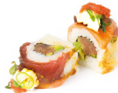
SPICY TATAKI ROLL