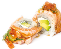
SALMON ROLL ABURI