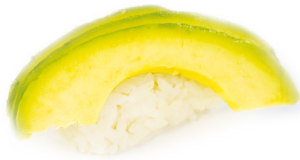
AVOCADO NIGIRI Avocado